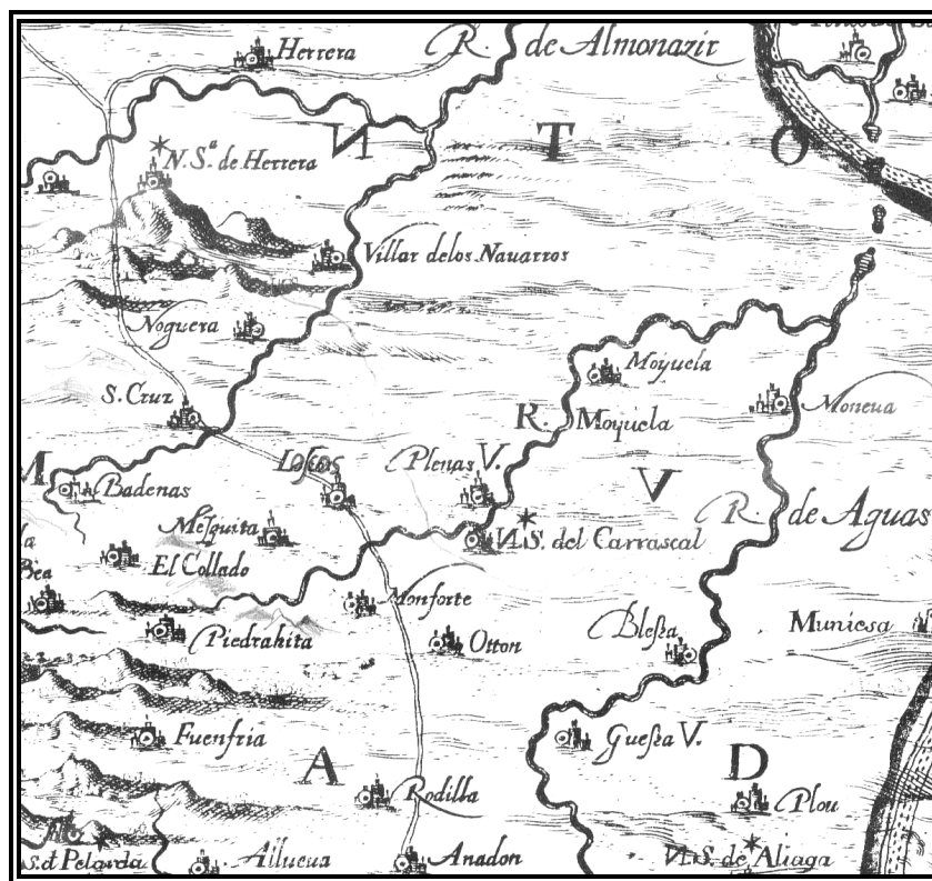
Cartografía de J. B. Labaña.

Cartográficamente hasta comienzo de los años 80 no aparece la Sierra de Oriche individualizada de la Sierra de Cucalón. Así aparece en el Mapa Regional de Aragón, editado por el Instituto Geográfico Nacional, Escala 1:300.000, Edición 1981. Después aparece en la Cartografía Militar de España, Escala 1:50.000, Hoja 27-18(466), Moyuela, Edición de 1983, y posteriormente, en 1989, en el Mapa Geológico de España, Escala 1:50.000, Hoja 27-18(466), Moyuela. A partir de entonces algunos autores hablan de Sierra de Oriche individualizada de la de Cucalón. Otros hablan de la Sierra de Cucalón-Oriche como una unidad y unos terceros siguen hablando únicamente de la Sierra de Cucalón para toda la zona.