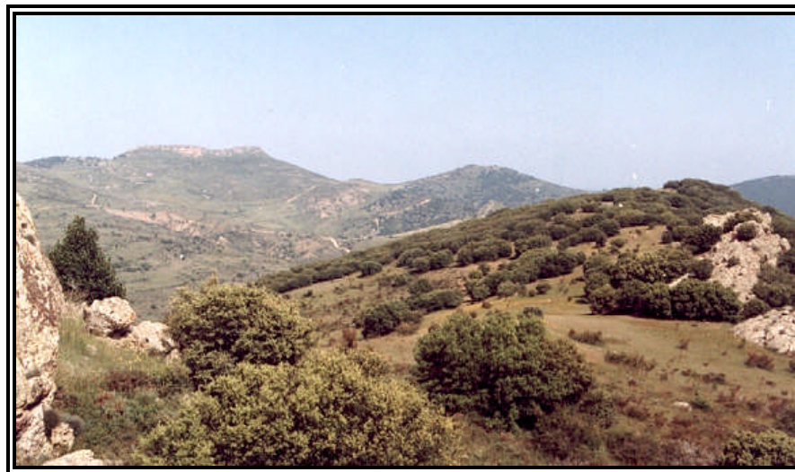
Vegetación de la Sierra de Oriche.

También aparecen estrechas bandas de avellanos en zonas umbrosas y más frescas sobre terrenos rocosos. En cuanto a las coníferas predomina el pino de repoblación en Monforte, Piedrahita y Badenas. En resumen: cuatro paisajes distintos, cuatro tonalidades para una tierra tranquila, por descubrir y valorar.