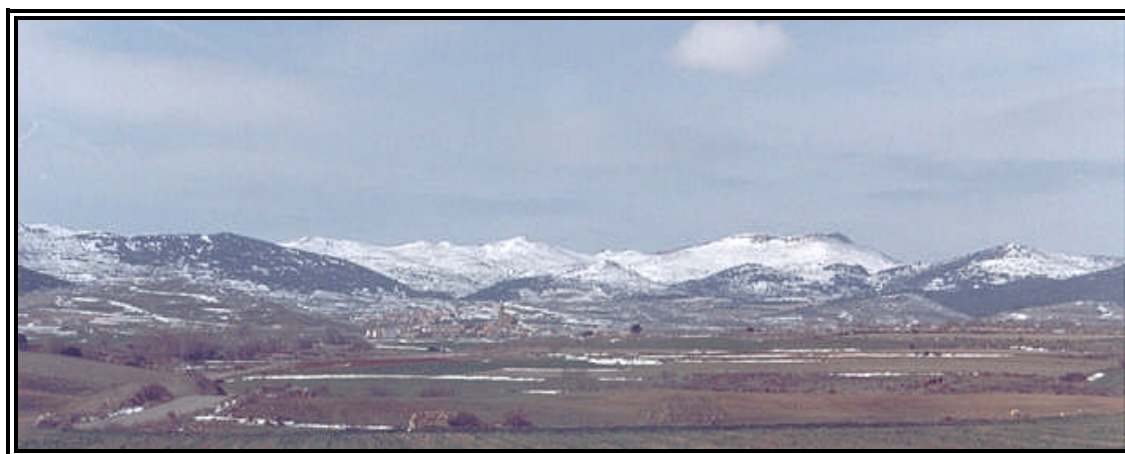
Lado Norte de la Sierra de Oriche nevada.

La Sierra de Oriche es una alineación montañosa, prolongación hacia el este de la Sierra de Cucalón. Tiene una orientación noroeste-sureste. Forma parte de la Cordillera Ibérica -Rama Aragonesa-. Está delimitada al noroeste por la Sierra de Herrera -cuyo pico más alto corresponde al Santuario de la Virgen con 1348 metros-; al sur por el estrecho valle que forman el nacimiento de los ríos Huerva en Fonfría y Aguasvivas en Allueva (que la separan de la Sierra Pelarda con los picos más altos de Pelarda (1510), Retuerta (1492) y Marojal (1485); al oeste la Sierra de Cucalón con Modorra (el Morrón) como pico más alto con 1482 metros y al este la Muela de Anadón con los picos de Barranco Cerrado (1322) y Cabezo Santo (1302). Al norte se extiende el piedemonte de Loscos hacia las llanuras del Valle del Ebro. Abarca los pueblos de El Colladico, Piedrahita, Mezquita y Loscos al norte; Bea al sur, Rudilla y Monforte al este y Badenas al oeste. Esta unidad geográfica, junto a otras de carácter histórico, cultural o social, ha dado nombre a una subcomarca natural que, por la mayor extensión territorial y poblacional de Loscos, se conoce con el nombre de Sierra y Campo de Loscos.