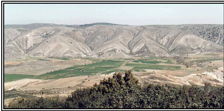
Cara Sur de la Sierra, donde se aprecian perfectamente los chevrons .

importante karstificación que se manifiesta por la presencia de extensos campos de pequeñas dolinas y grupos de lapiazes. Por su vertiente norte el desnivel es muy acusado, presentando un escarpe casi vertical que en algunos puntos alcanza hasta 100 metros de desnivel encima de los núcleos de Piedrahita y El Colladico, mientras que en la vertiente sur es más suave. Hacia Loscos se extiende un extenso glacis de piedemonte pliocuaternario. La red fluvial se encaja sobre las rampas pliocuaternarias e incide intensamente la superficie de erosión de las zonas más elevadas de materiales paleozoicos dando lugar a distintos tipos de relieves estructurales: barras, cuestas y hog-backs , todos ellos de distinto recorrido. Sobre los materiales mesozoicos aparece una estructura monoclinas que se modela en un hog-back de largo recorrido y en espectaculares chevrons sobre calizas del Cretácico Superior en su vertiente sur (junto a Fonfría). Esta red fluvial es de tipo de valle de fondo plano incididos, a veces, por redes de barrancos de incisión lineal que producen profundas gargantas